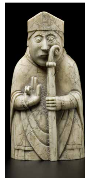
FIG. 7: Bisper var vigtige brikker i middelalderens magtspil. Her ses en biskop som skakbrik fra 1100-tallet. Fundet på Øen Lewis i de Ydre Hebrider, men formentlig fremstillet i Norge eller et andet sted i Norden.

Først fra 1100-tallet og frem har vi en fuldstændig liste over biskopperne på Fyn. Fra 1000-tallet kender vi kun navnene på to bisper, nemlig Reginbert og Eilbert. De må formodes at have resideret i Odense og er begge kendt fra Adam af Bremens krønike