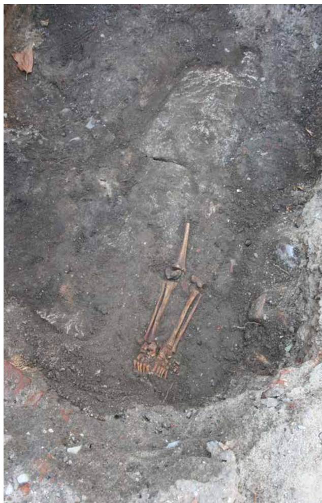
FIG. 9: Direkte oven på frådrenskisten lå rester af yngre middelalderlige begravelser. Der tyder på, at bispegraven var gået ind i glemslen allerede i middelalderen.

frådrenskisten eller nedtone hans betydning. Hvis det er Eilbert, har domkapitlet ved Skt. Knuds Kirke uden tvivl opfattet ham som repræsentant for Hamborg-Bremen, uagtet han måske støttede de danske bestræbelser på løsrivelse. Ved udgravningen af frådrenskisten blev der fundet rester af yngre begravelser, som var lagt direkte oven på kistens lågsten (fig. 9). Det tyder på, at gravens placering var glemt allerede i middelalderen, og at en eventuel markering i kirkens gulv var forsvundet – måske allerede i forbindelse med trækirkens ombygning til en stenkirke i 1100-tallet. Det er ikke utænkeligt, at den omtalte frådrenskiste, som blev fundet i 1917, kan have rummet en anden af 1000-tallets efterladte odensebisper. Den glemte biskop i Skt. Albani Kirke er et håndgribeligt udtryk for, hvordan eftertiden skriver historien, og hvordan selv personer, der var magtfulde i deres samtid, kan forsvinde ind i den kollektive glemsel.