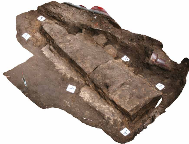
FIG. 2: Kistens lågsten set fra sydøst. Foto og 3D-model: Arkæologisk IT, Aarhus Universitet og Odense Bys Museer.

Ground plan of the wooden St Alban's Church 1:150. The grave is marked in light yellow. Drawing: Odense City Museums.