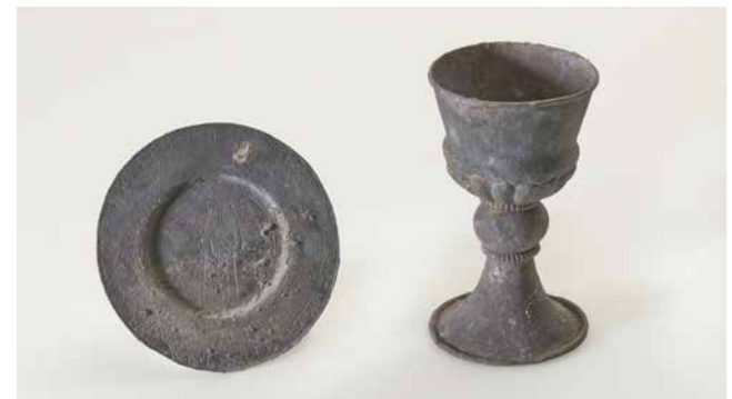
FIG. 5: Nadversættet efter afrensning og konservering. Kuglen på stilken omgivet af perlekranse er karakteristisk for samtidige tyske gravkalke, men blade nederst på bægeret er et særtræk for den odenseanske kalk.

The set after cleaning and stabilising.