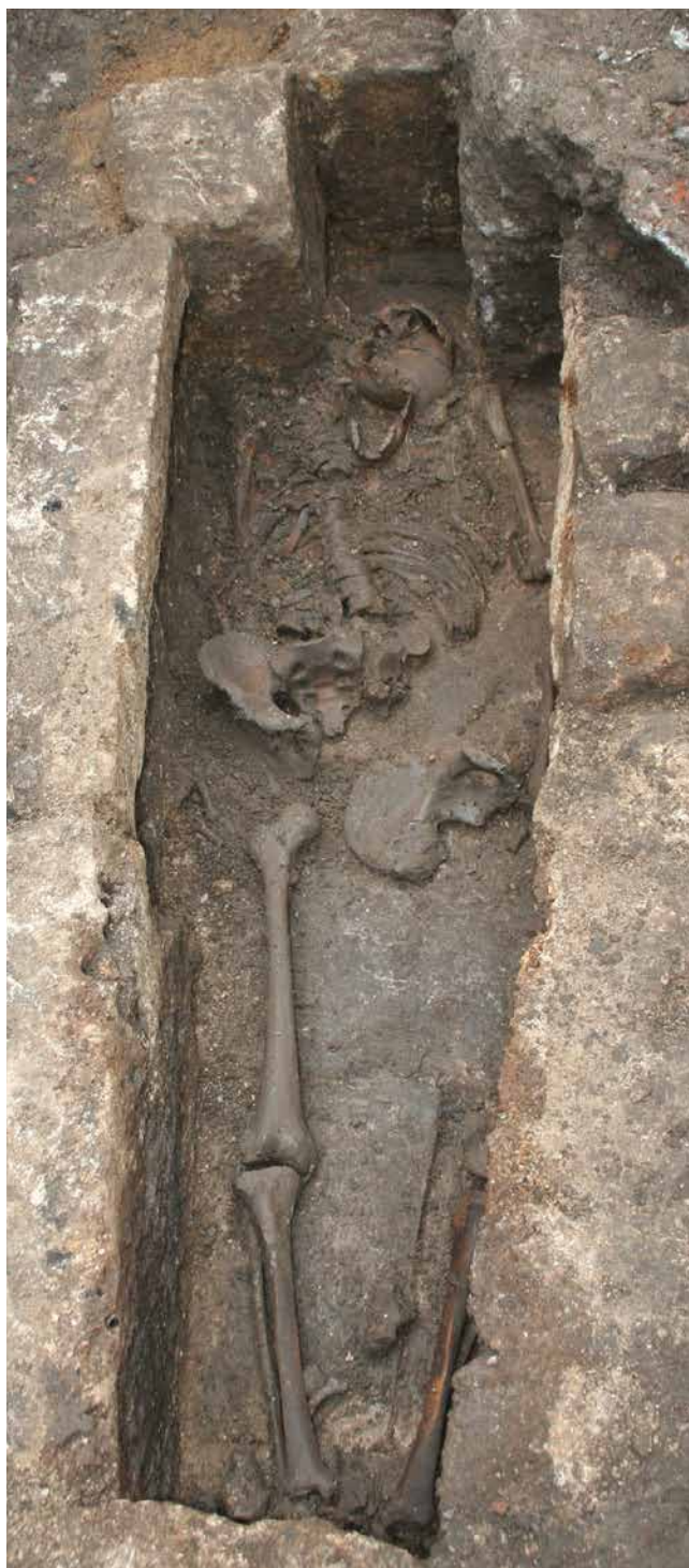
FIG. 3: Graven efter oprensning set fra øst. The grave after the excavation.

fremkom et trapezformet kammer med separat niche til hovedet. Hver langsideside bestod af to store frådstensblokke, som var samlet med ovennævnte mørtelblanding. Blokkene var kun tilhuggede med plane sider ind mod selve kisterummet, mens ydersiderne, som ikke blev blotlagt, formodes i rå sten. Kisten målte indvendigt 199 cm fra hovedende til fodende, mens bredden varierede fra 66 cm ved skuldrene til 31 cm i fodenden. Bunden af kisten udgjordes af fliser, som var udhugget i en væsentligt hårdere type frådsten end den øvrige kiste. Derfor havde fliserne en meget jævn overflade i modsætning til låget og sidernes ru og furede overflader. 2