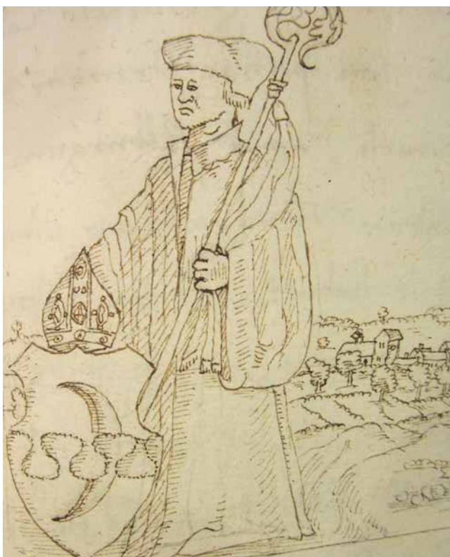
FIG. 8: Biskop Jens Andersen Beldenak bar våbenskjold, på trods af at han ikke var adelig. Tegning af historikeren Cornelius Hamsfort d.y. fra slutningen af 1500-tallet, som han forestillede sig bispen.