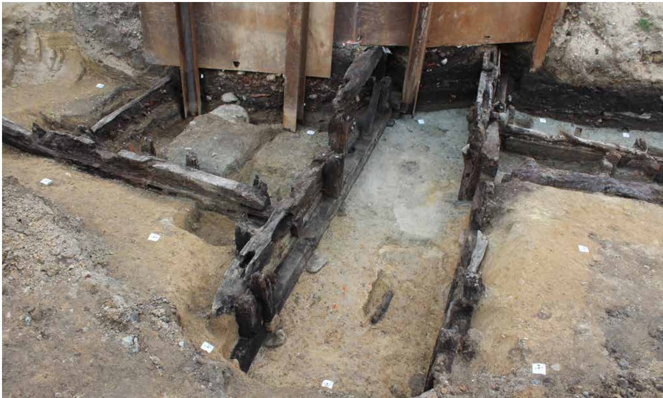
FIG. 4: Broens to faser set fra vestsydvest. Bl.a. ses den store fodrem, hvori bropillerne er tappet. Brofasernes oprindelige afslutning er forrest i billedet, mens broerne fortsætter uden for udgravningsfeltet bagest i billedet.