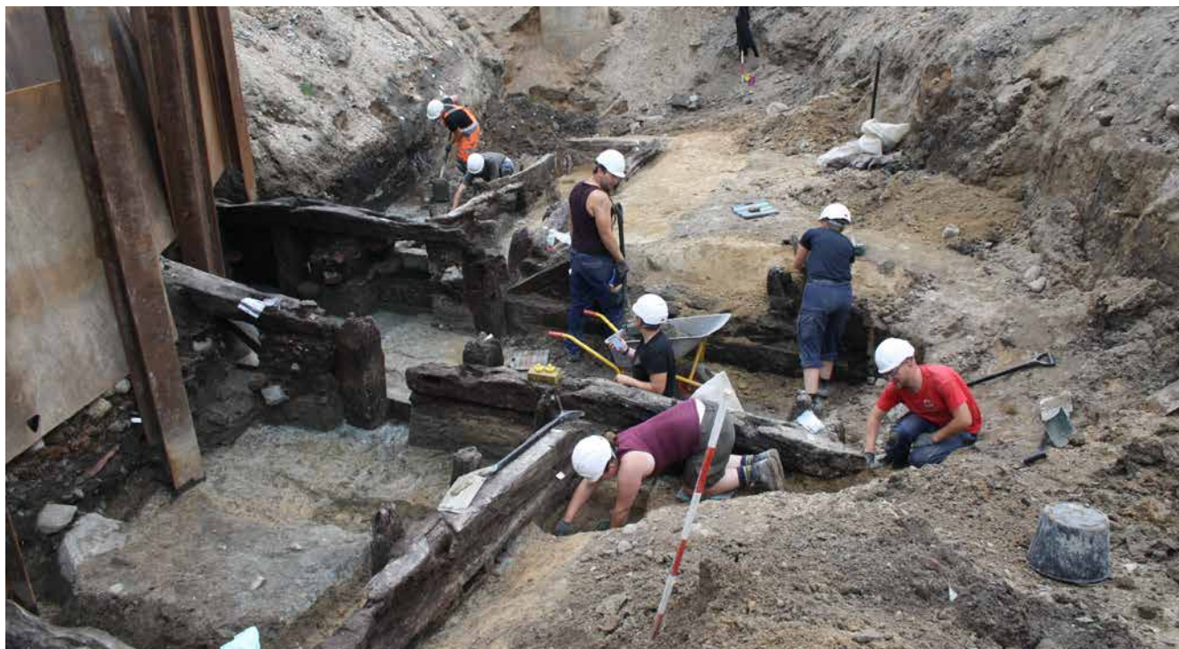
FIG. 3: Anlægget under udgravning. Set fra vestnordvest.

During the excavations. Seen from the west-northwest.