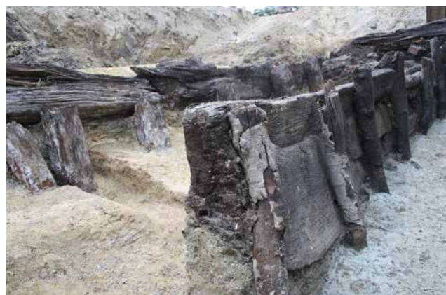
FIG. 5: Detaljebillede, som viser de to faser i bolværker mod syd. Set fra østsydøst. Til venstre i billedet det ældste bolværk med tilhuggede bjælker og pæle. Midt i billedet det yngre bolværk af brædder og rafter med bark på.

bolværk på hver side af broen, opført i regulære vandretliggende bjælker, som blev holdt på plads af tilhuggede, kraftige pæle. Det sydligste af disse bolværker har dog på et tidspunkt givet efter, og man har i al hast lavet et nyt bolværk et stykke ude i voldgraven for at holde jordmasserne tilbage (fig. 5). Dette yngre bolværk bestod af tilfældige planker og rafter, der blev holdt på plads af tynde lodrette rafter, som hverken var tilhuggede eller afbarkede.