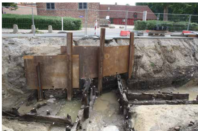
FIG. 2: Broen og bolværk under udgravning 2016. Set fra vest. Midt i billedet ses de parallelle forløb af begge broens faser. På hver side af broen ses de bolværker, som har holdt på gravens sider. I baggrunden ses gavlen fra bispegårdens (ombyggede) nordfløj.

The bridge and bulwark during the 2016 excavations. Seen from the west. In the centre of the picture, the parallel runs of the bridge's two phases. On either side of the bridge, the bulwark securing the sides of the moat is visible. In the background, the end wall of the (reconstructed) north wing of the bishop's palace.