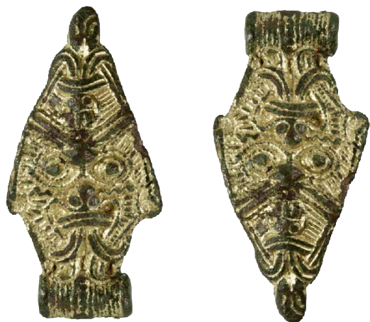
FIG. 9: Fixérmaske i forgyldt bronze fra Ejby Mølle øst for Odense.