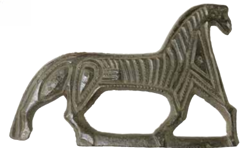
FIG. 8: Hesteformet dragtnål i bronze fra Avnslev ved Nyborg.

Snake-shaped brooch in bronze from Vester Kærby, east of Odense.