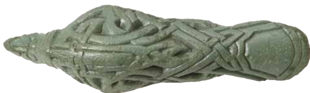
FIG. 6: Ravneformet dragtnål i bronze fra Vester Kærby øst for Odense.

Silver Thor's hammer from Føns on west Funen.