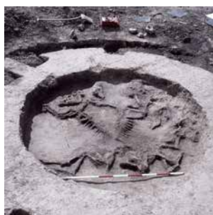
FIG. 3: Grube med ofrede heste fra Jyllandsvej ved Middelfart.

Pit with sacrificed horses from Jyllandsvej near Middelfart.