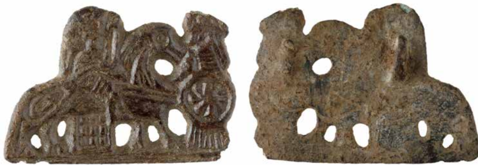
FIG. 12: For- og bagside af valkyriefibel i bronze fra Nonnebakken i Odense. Front and reverse of bronze Valkyrie brooch from Nonnebakken.

by ved Rynkeby på Midtyn og vikingeborgen Nonnebakken i Odense (fig. 12). 31 Smykketyper dateres til 800-tallet. På forsidens ses til højre en såkaldt skjoldmø med skjold og sværd – også en mytologisk figur, der hjalp krigerne på slagmarken – og til venstre valkyrien med lanse på sin hest. Under hesten ses et firkantet, ternet klæde, der opfattes som et skæbneklæde, som ifølge mytologien er vævet af de faldne krigeres tarme. 32