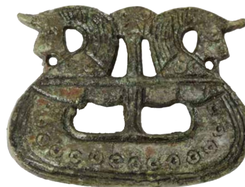
FIG. 10: Skibsformet dragtnål i bronze fra Hårby på Sydvestfyn.

Som nævnt har en nytolkning af en lille gruppe smykker og afbildninger af mandsmasker ført til en mulig påvisning af dyrkel-