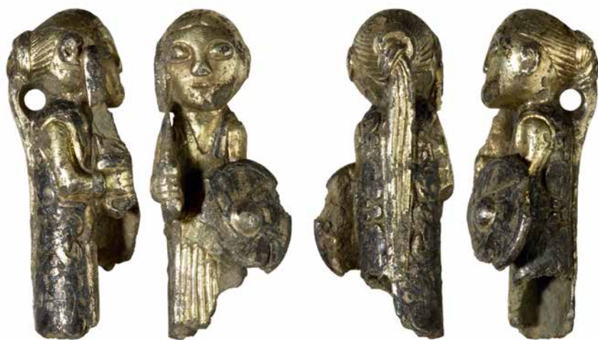
FIG. 11: Valkyrie i forgyldt sølv fra Hårby på Sydvestfyn. Valkyrie in silver from Haarby, south-west Funen.

Fra samme lokalitet som skibet fremkom et mindst lige så fantastisk detektorfund, nemlig en lille tredimensionel kvindefigur i forgyldt sølv fra tidlig vikingetid (fig. 11). Genstandens funktion er uvis. Fundet er specielt på flere måder. For det første er det usædvanligt med tredimensionelle figurer fra vikingetiden, og for det andet har genstanden en meget detaljerig dragt, frisur, skjold og sværd. Figuren skal formentlig opfattes som en af de omtalte valkyrier, der fragtede de faldne krigere til Valhal. Valkyrierne optræder også på andre typer af genstande. Således er der inden for de seneste år fundet enkelte såkaldte valkyriefibler, dragtnåle, fra forskellige lokaliteter på Fyn. Lokaliteterne har alle haft en særlig position i datidens samfund og udgøres af en stor metalrig lokalitet øst for Odense, Vester Kærby, en central lands-