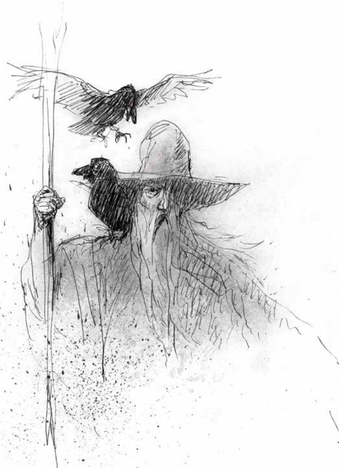
FIG. 4: Odin i tegneren Sune Elskærs fortolkning. Odin interpreted by the artist Sune Elskær.

Tilknyttet Odin er også en række dyr, der symboliserer Odins evne til at skifte skikkelse, og som hver især har særlige evner. Ravnene Hugin og Munin, hvis navne betyder "tanken" og "erindringer", sidder på Odins skuldre, men sendes også ud i verden for at bringe nyt til Odin. 12 Ulvene Gere og Freke, "den grådige" og "den glubske", ligger ved Odins fødder og er bl.a. ligædere på slagmarkerne. 13 Den ottebenede hest Sleipner flyver gennem luften og kan fragte Odin, hvorhen han vil. Odin ses af og til placeret i sin trone, Hjildskjalv, hvorfra han kan overskue hele verden og se alt. 14 Odin afbildes traditionelt som blind på det ene øje, hvilket skyldes, at han ofrede sit ene øje i Mimers brønd (visdommens brønd) for at opnå visdom. 15 Odin bestemmer kriges udfald og sørger for, at de faldne krigere bliver fragtet til Val-