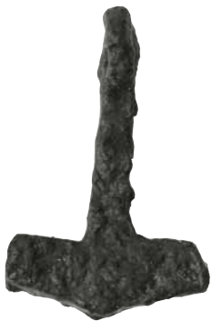
FIG. 5a: Thorshammer i jern fra Strandby på Sydvestfyn.

A Thor's hammer of iron from Strandby on south-west Funen.