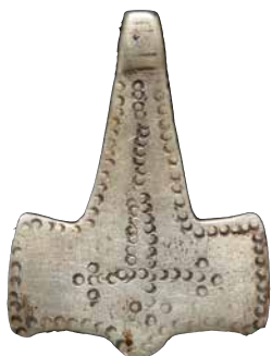
FIG. 5b: Thorshammer i sølv fra Føns på Vestfyn.

A Thor's hammer of iron from Strandby on south-west Funen.