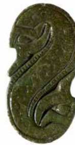
FIG. 7: Slangeformet dragtnål i bronze fra Vester Kærby øst for Odense.

Thorshammeren – Thors særlige kendetegn – er en af de mest almindelige genstande med forbindelse til den nordiske mytologi. Hamrene findes i sølv, rav, bronze, kobber og bly, men mest almindeligt i jern. De findes enkeltvis, i grupper eller sammen med f.eks. små stave, ophængt i en ring, og findes på bopladser, i grave og i skatte. Thorshamrene optræder næsten udelukkende