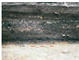
FIG. 2: Den sydligste del af et lodret snit gennem kulturlaget nord for Nonnebakken. I den nederste del af profilet ses et sort lag med ildskærmede granitsten. Laget overlejres af yngre lag. Laget overlejres af yngre lag.

The southernmost part of a vertical section of cultural strata north of Nonnebakken, seen from the east. The black layer containing fire-shattered granite can be seen at the base of the stratum. Redeposited medieval and later deposits were superposed on this.